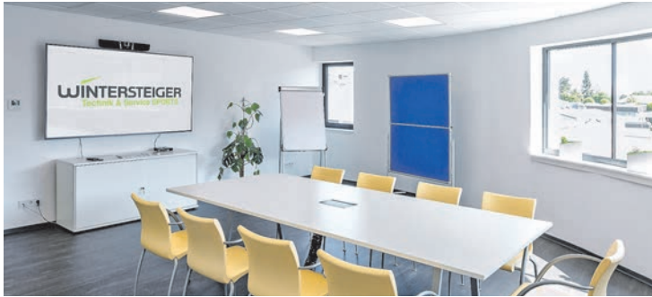
Der Besprechungsraum mit modernster Konferenz-Videotechnik.

top ausgestatteten Gebäudes für das Geschäftsfeld SPORTS.