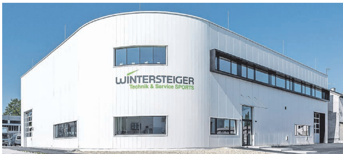
Das moderne Gebäude bietet Platz und technische Ausstattung für noch mehr Innovation.

RIED. Als international erfolgreiches Unternehmen bietet die WINTERSTEIGER AG seit der Gründung im Jahre 1953 innovative Lösungen für Kunden in technisch anspruchsvollen Nischenmärkten. Die Geschäftsfelder der Unternehmensgruppe umfassen SEEDMECH (Feldversuchstechnik), SPORTS (Skiservice & Verleih), WOODTECH (Holzbearbeitung) und METALS (Richttechnik). WINTERSTEIGER ist dabei Weltmarktführer in den Geschäftsfeldern SPORTS, SEEDMECH und WOODTECH.