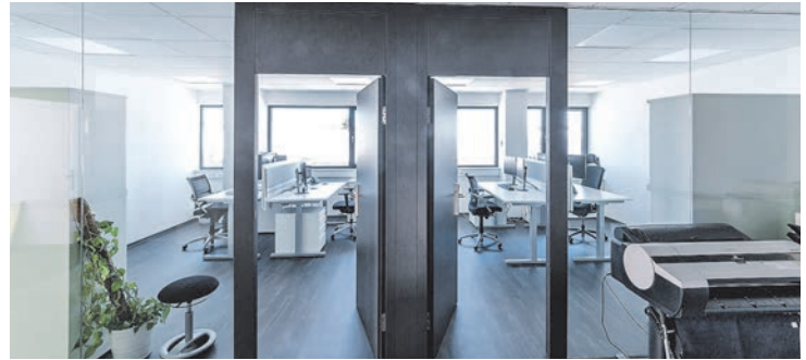
Die hellen Büros sorgen für höchsten Arbeitskomfort.

Erfahrungen über Maschinen, welche lange am Markt waren, in die Neuentwicklungen einfließen.